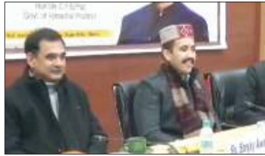
विभिन्न स्तर के कर्मचारियों और इंजीनियर को सम्मानित किया गया उन्होंने कहा कि आपदा के समय में प्रदेश में भारी तबाही हुई 4000 के करीब सड़के बंद हुई ऐसे में विभाग के कर्मचारियों ने कड़ी मेहनत के साथ उन सड़कों को बहाल करने का काम किया लंबे समय से इस कार्यक्रम को आयोजित करना था, लेकिन अब जाकर इसको आयोजित किया गया है। उन्होंने कहा कि कर्मचारियों को सम्मान के साथ-साथ आगामी समय में बेहतर ढंग से काम करने के लिए आग्रह भी किया गया।

हिमाचल प्रदेश लोक निर्माण विभाग की ओर से प्रदेश में विभाग के इंजीनियर और कर्मचारियों को बेहतर काम के लिए सम्मानित किया गया। इस मौके पर शिमला में कार्यक्रम आयोजित हुआ जिसमें लोक निर्माण मंत्री विक्रमादित्य सिंह ने शिरकत की उनके साथ मुख्य संसदीय सचिव संजय अवस्थी भी मौजूद रहे। हिमाचल प्रदेश लोक निर्माण मंत्री विक्रमादित्य सिंह ने कहा कि विभाग की ओर से आज सम्मान समारोह का आयोजन किया गया जिसमें विभाग के विभिन्न स्तर के कर्मचारियों और इंजीनियर को सम्मानित किया गया उन्होंने कहा कि आपदा के समय में प्रदेश में भारी तबाही हुई 4000 के करीब सड़के बंद हुई ऐसे में विभाग के कर्मचारियों ने कड़ी मेहनत के साथ उन सड़कों को बहाल करने का काम किया लंबे समय से इस कार्यक्रम को आयोजित करना था, लेकिन अब जाकर इसको आयोजित किया गया है। उन्होंने कहा कि कर्मचारियों को सम्मान के साथ-साथ आगामी समय में बेहतर ढंग से काम करने के लिए आग्रह भी किया गया।